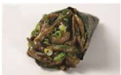
SHIMEJI • R$ 26,90

Peixe Prego, pimenta dedo-de-moça, cebola roxa, raspas e suco de limão