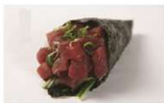
ATUM COMPLETO • R$ 35,90