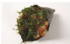
SALMÃO COM COUVE • R$ 29,90