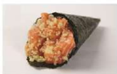
SALMÃO CRISPY • R$ 29,90