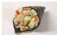
PEIXE PREGO SPICY • R$ 28,90

Peixe Prego, pimenta dedo-de-moça, cebola roxa, raspas e suco de limão