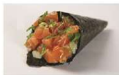
SALMÃO COMPLETO • R$ 29,90