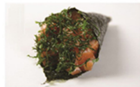
SALMÃO COM COUVE • R$ 29,90