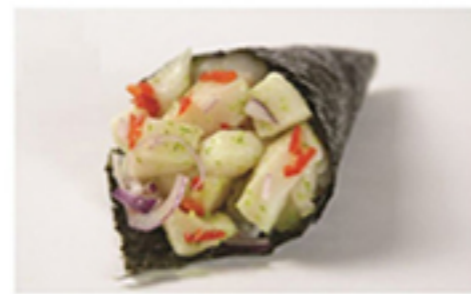
PEIXE PREGO SPICY • R$ 28,90

Peixe Prego, pimenta dedo-de-moça, cebola roxa, raspas e suco de limão