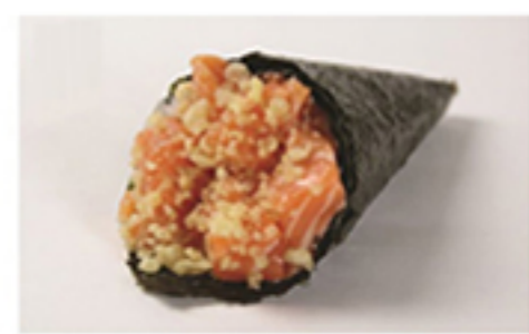
SALMÃO CRISPY • R$ 29,90