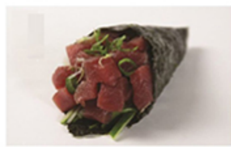
ATUM COMPLETO • R$ 31,90