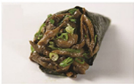
SHIMEJI • R$ 24,90

Peixe Prego, pimenta dedo-de-moça, cebola roxa, raspas e suco de limão