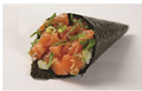
SALMÃO COMPLETO • R$ 29,90