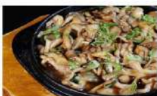
SHIMEJI BATAYAKI • R$ 25,90