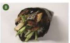
SALMÃO SKIN • R$ 22,90