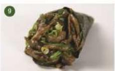
SHIMEJI • R$ 27,90