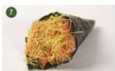
SALMÃO COM BATATA • R$ 27,90