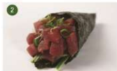
ATUM COMPLETO • R$ 27,90