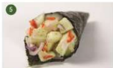
PEIXE PREGO SPICY • R$ 25,90

Peixe branco, cebolinha e raspas de limão