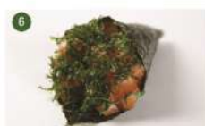
SALMÃO COM COUVE • R$ 27,90

Peixe Prego, pimenta dedo-de-moça, cebola roxa, raspas e suco de limão