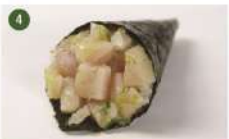
PEIXE PREGO CITRON • R$ 25,90

Peixe branco, cebolinha e raspas de limão