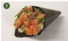
SALMÃO COMPLETO • R$ 27,90