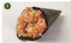
SALMÃO CRISPY • R$ 27,90